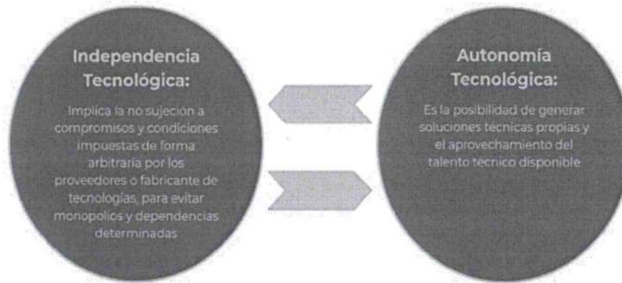
Figura 2. Visión de la EDN

Visión: Un país digitalizado y un gobierno austero, honesto y transparente, con autonomía e independencia tecnológicas, centrado en las necesidades ciudadanas, principalmente de los más pobres.